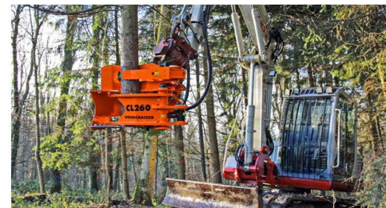
Optional auch mit Sammelgreifer.