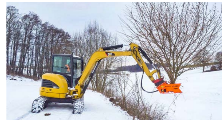
Für Minibagger ab 2,5t.