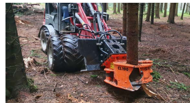
Woodcracker® CL schneidet weiches Holz bis zu 40cm.