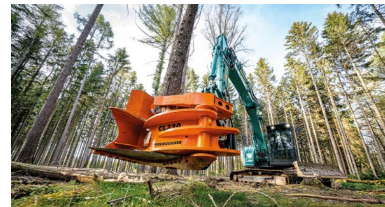
Schnelle Ernte von kleinen Bäumen.